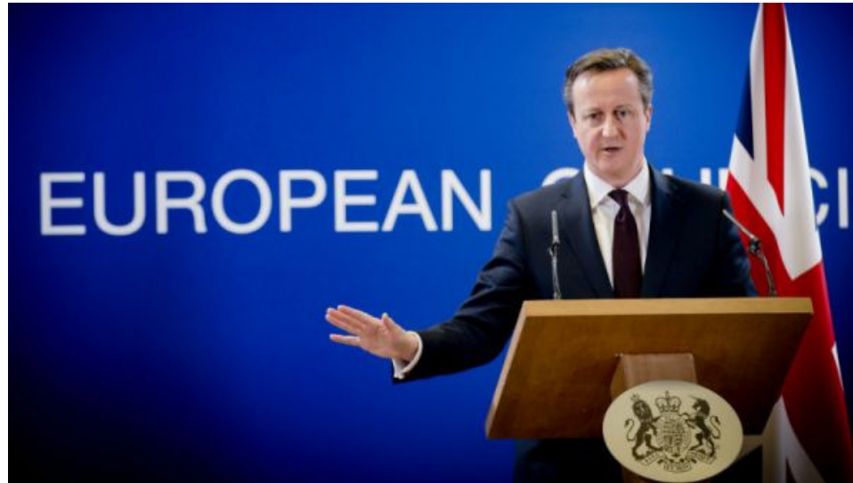
Der britische Premierminister Cameron hat ein Referendum über die EU-Mitgliedschaft versprochen